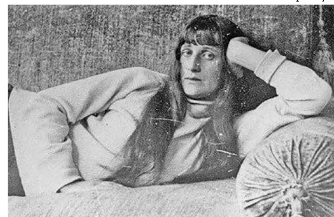
No dia 23 foi lembrado os 133 anos de nascimento da poeta