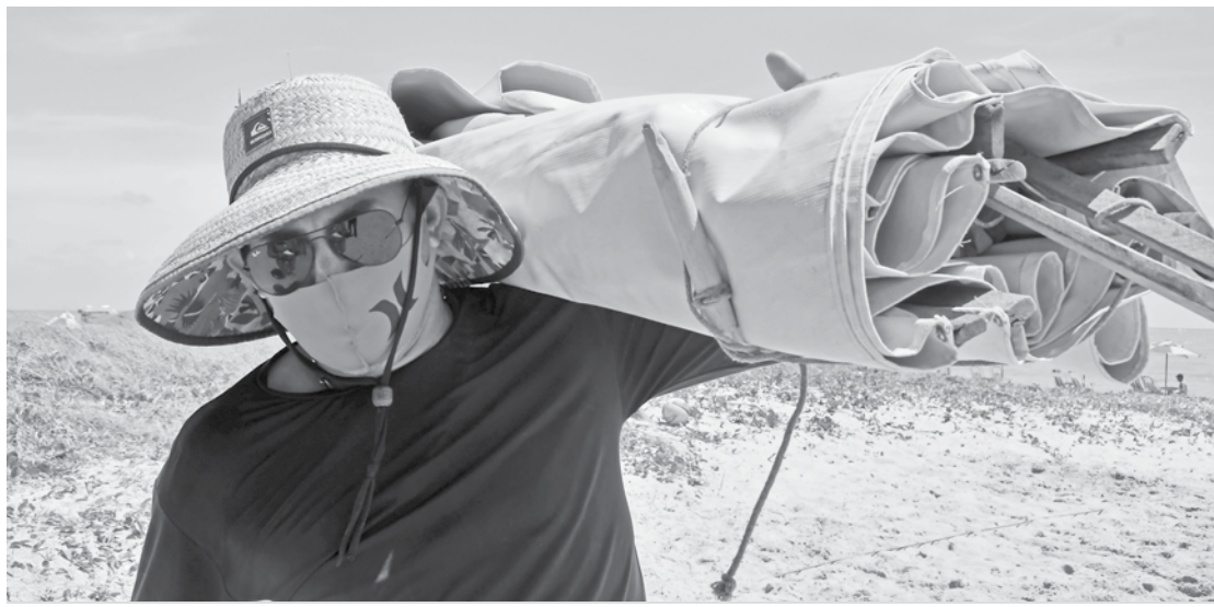
Se tem sol, tem praia!