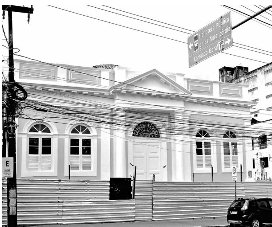
Biblioteca estadual será entregue pela manhã, enquanto o Museu da Polícia Militar será inaugurado à tarde pelo governador

À tarde, a partir das 15h, o governador vai inaugurar a Reforma e Ampliação da Companhia de Policiamento com Cães (Canil do Bope), em Camboinha, Cabedelo. A partir das 16h30, João Azevêdo inaugura a 3ª Delegacia Distrital, localizada na Vila Olímpica Parahyba, em João Pessoa. Por fim, o governador inaugura o Museu da Política Militar da Paraíba, no Parque Solon de Lucena.