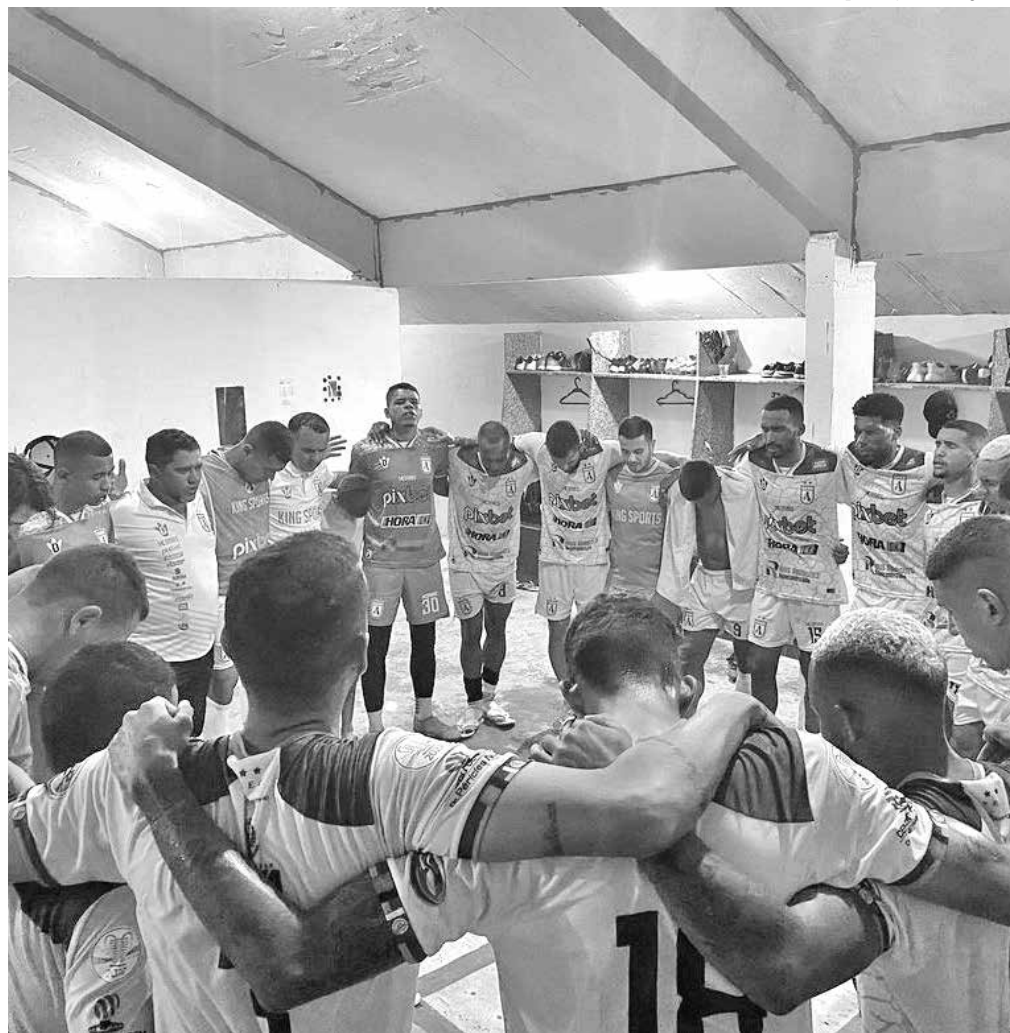
Jogadores do Sousa vão precisar de muita concentração para buscar mais uma vitória, hoje, na Série D do Campeonato Brasileiro e se manter na zona de classificação da segunda fase