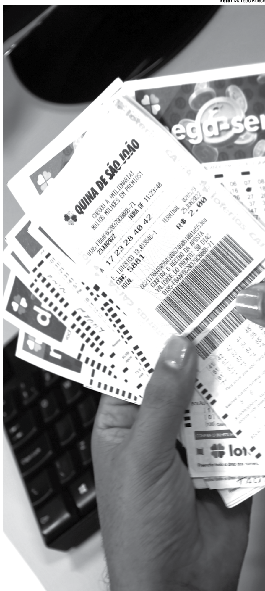
Prêmio a ser sorteado no Maior São João do Mundo está estimado em R$ 200 milhões

Bolada Sorteio será 2ª maior premiação da história